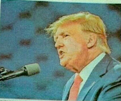
EL EXPRESIDENTE Donald Trump dijo que le dieron "un plazo muy corto de cuatro días" para personarse ante un gran jurado, "lo que casi siempre significa un Arresto y Acusación".

Expresidente reitera que esta caza de brujas tiene que ver con la interferencia electoral y uso de la ley como arma política