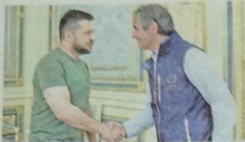
EL PRESIDENTE ucraniano, Volodimir Zelenski, recibió a los inspectores del Organismo Internacional de la Energía Atómica (OIEA) que preparan una misión a la central de Zaporíyia.

Según Zelenski, esto debe incluir "la partida de todos los